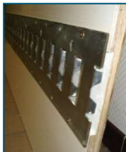
Raíl horizontal semiencastrado