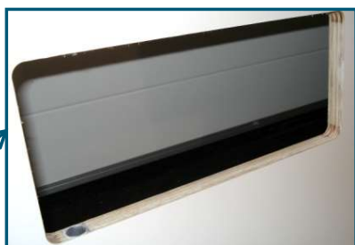
Corte para cerraduras de puerta

Raíles verticales, horizontales, encastrados o semiencastrados, desde la mecanización a la instalación: