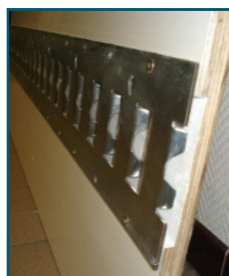
Rail horizontal semi-encastré