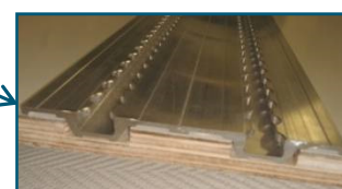
Rail vertical semi-encastré